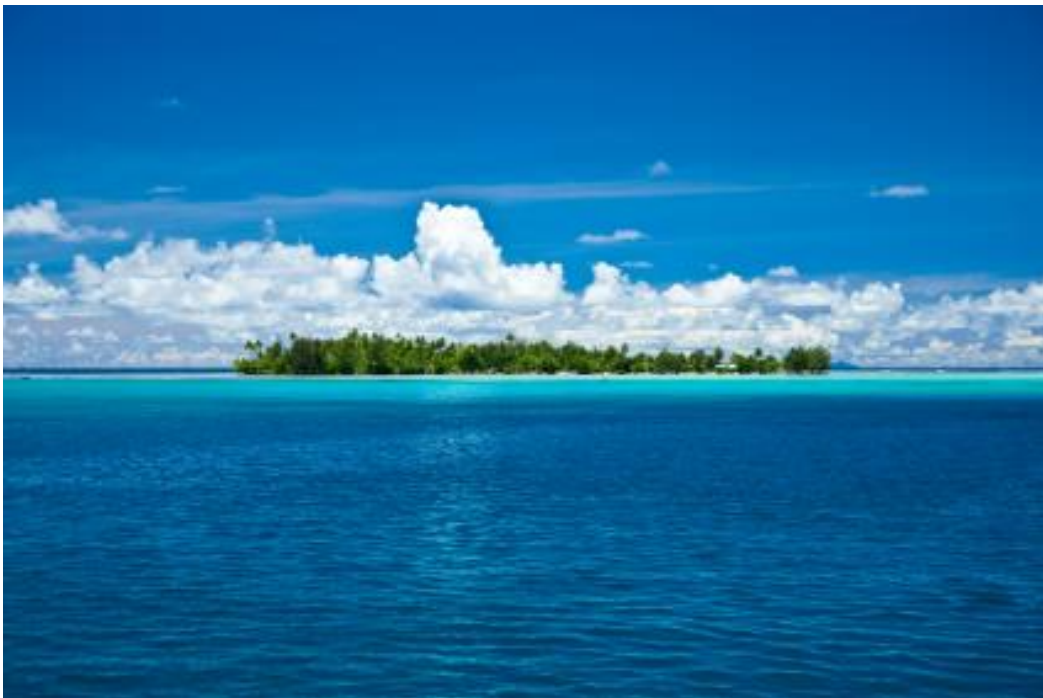
ei aud øy