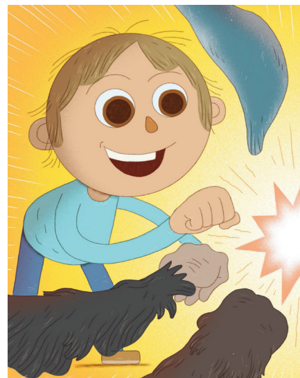
Utsnitt frå boka.

www.nrk.no/osloogviken/han-vil-at-du-skal-danse-til-jobb-1.11933783