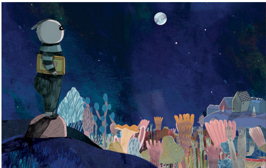
Kjell på veg mot skogen. (Utsnitt frå boka)