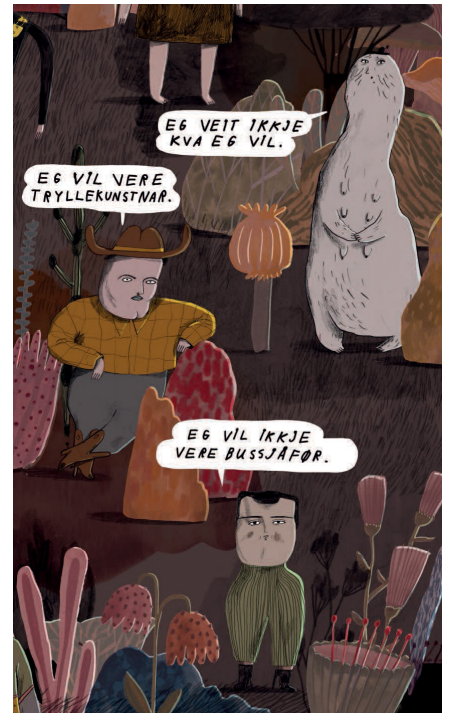
Utsnitt frå boka.

Før de byrjar arbeidet, kan klassen gjerne sjå på teikneserien «Kva du kan gjere med ein teikneserie som du ikkje må fortelje mor di» i lag. Der kan de i hovudsak sjå på det som handlar om utsnitt (nærbilete osv.).