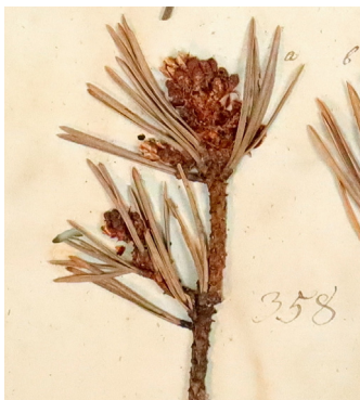
▲ Furu frå herbariet til Ivar Aasen