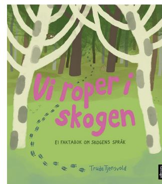
Vi roper i skogen – ei faktabok om skogens språk Trude Tjensvold