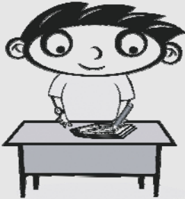
Leo skriv .

Verb fortel kva som skjer eller kva nokon gjer.