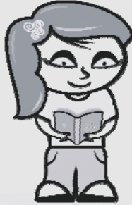
Luisa les .