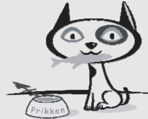
Prikken et .