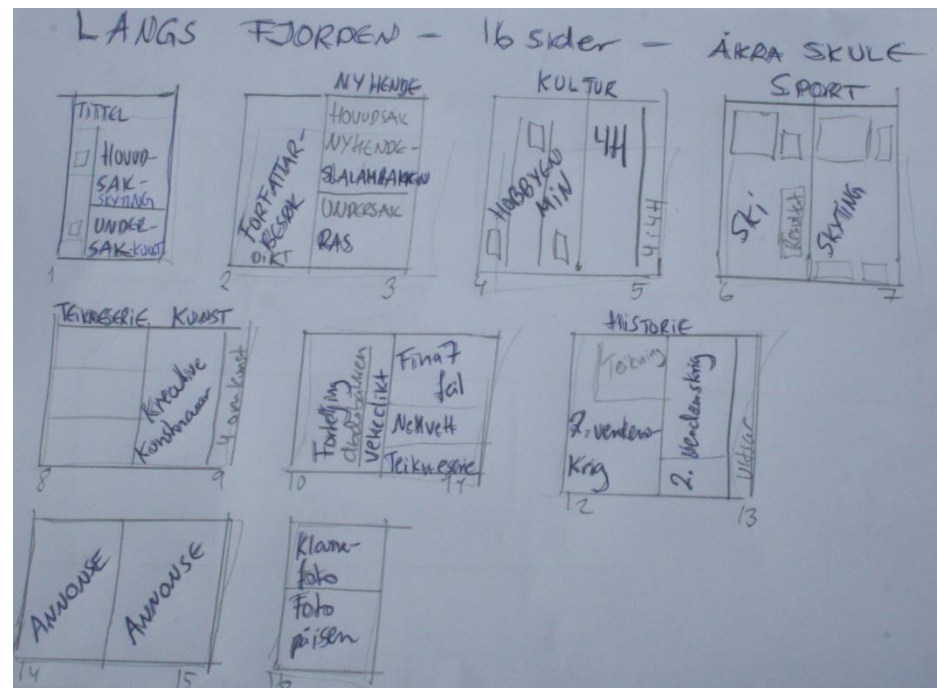
Døme på plan for skuleavisa Langs fjorden, Åkra.